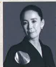
河瀬 直美氏